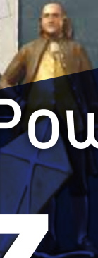
1999 Bertrand Piccard & André Borschberg